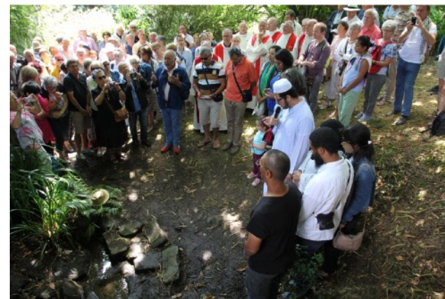
Lecture de la sourate des Gens de la Caverne (pardon 2019).