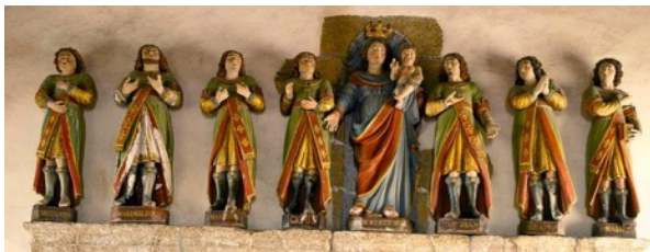
Les sept statues des Dormants d'Éphèse de la chapelle.