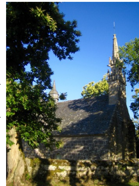
Chapelle des Sept-Saints.